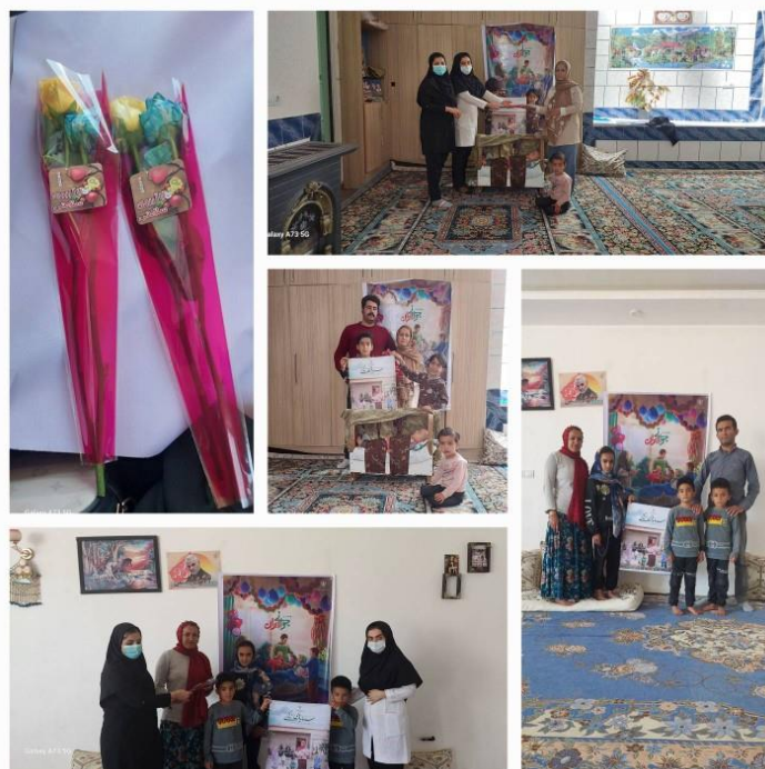
۶۱- تجلیا از خانواده های با شکوه مرکز برآفتاب توسط پرسنل محترم مرکز در ۱۴۰۲/۲/۲۵