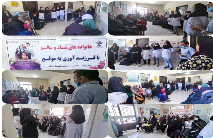
۲۸- برپایی میز خدمت در مرکز شهری شماره یک و مرکز مشاوره هنگام ازدواج همراه با آموزش در مورد وجوه مثبت و ارزشمند ازدواج حمایت از نقش مادری و همسر معایب استفاده از روش های پیشگیری و فرزند آوری به موقع توسط پرسنل مرکز جامع سلامت شماره ۱ شهری ب حضور ۱۰۰ شرکت کننده در تاریخ ۱۴۰۲/۲/۲۷