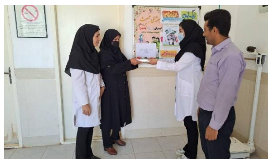
۶۵- تجلیل از مادر دارای ۱۰ فرزند در شهرک هجرت توسط پرسنل مرکز جامع سلامت در تاریخ ۱۴۰۲/۲/۲۴