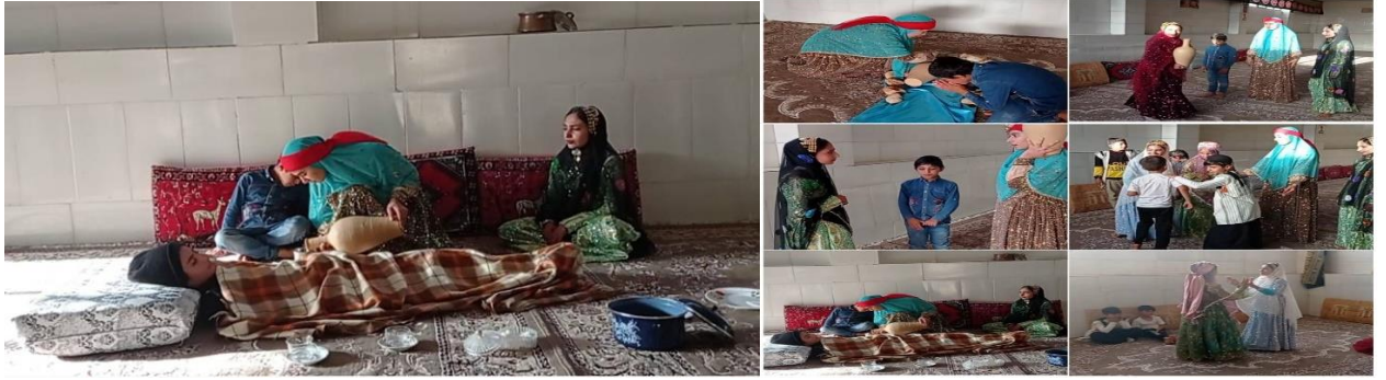
۲۷- جلسه آموزشی همراه با ارائه مشاوره های فرزندآوری و ذکر معایب تک فرزندی توسط پرسنل مرکز جامع خدمات سلامت شهرک با حضور ۳۵ نفر از زنان واجد شرایط در تاریخ ۱۴۰۲/۲/۲۵