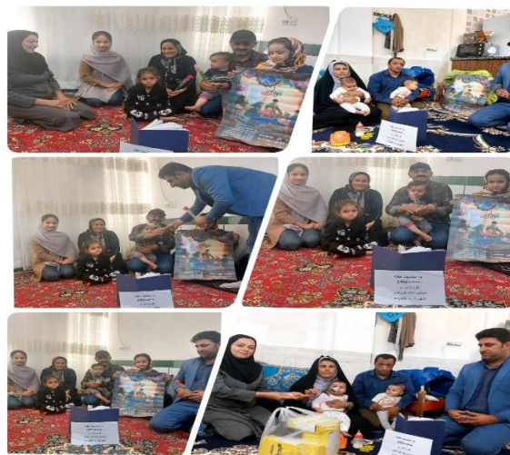
۵۹- تجلیل از خانواده با شکوه در روستای سرقلعه توسط پرسنل مرکز سرقلعه در تاریخ ۱۴۰۲/۲/۲۸