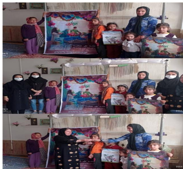
۶۰- تجلیل از خانواده با شکوه روستای شیرانی توسط پرسنل پایگاه شیرانی در ۱۴۰۲/۲/۳۰