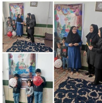
۶۳- تجلیل ز خانواده ز شکوه روستای دما ب مرکز شاه نجف توسط پرسنل مرکز شاه نجف با هدایای هدیه در ۱۴۰۲/۲/۳۰