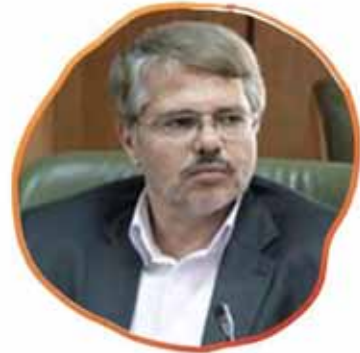
رئیس مرکز سلامت محیط و کار وزارت بهداشت، درمان و آموزش پزشکی از ممنوعیت استفاده از آزیست در مصالح ساختمانی از شهریور ۹۱ خبر داد.

وزیر بهداشت، درمان و آموزش پزشکی به مناسبت روز ملی بهداشت محیط پیامی صادر کرد.