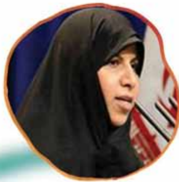
رئیس مرکز سلامت محیط و کار وزارت بهداشت، درمان و آموزش پزشکی به مناسبت روز ملی بهداشت محیط پیامی صادر کرد.

وزیر بهداشت، درمان و آموزش پزشکی به مناسبت روز ملی بهداشت محیط پیامی صادر کرد.