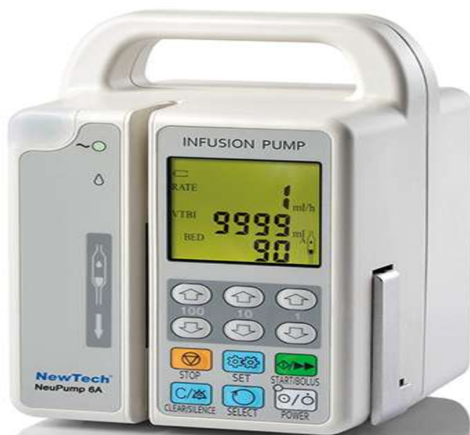
دستگاه اینفیوژن پمپ

گیری شده و هرگاه خطایی در این پارامترها یا سایر پارامترهای دیگر مانند اتمام باتری، مایع تزریقی و ممانعت از آسیب رسیدن به رگ بیمار حین افزایش احتمالی بیش از حد فشار تزریق دهد، دستگاه با قطع تزریق و آلام اپراتور را آگاه خواهد نمود.