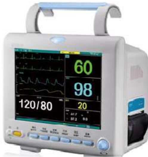
مانیتور بالای تخت