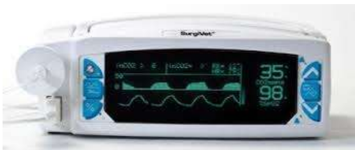
پالس اکسی متر

متصل می‌گردد. دستگاه جهت اندازه‌گیری اکسیژن اشباع شده در خون می‌باشد که میزان اکسیژن را در فواصل زمانی مشخص اندازه‌گیری و معدل‌گیری نموده و ثبت می‌نماید.