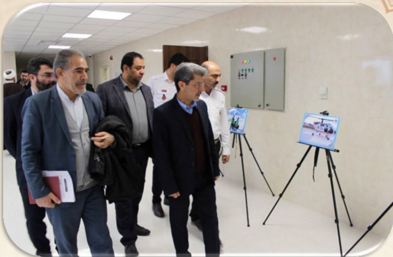
حضور ریاست مرکز در استودیو سلامت