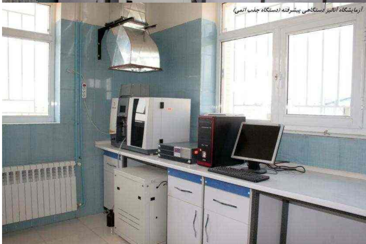
آزمایشگاه آنالیز دستگاهی پیشرفته (دستگاه جذب اتمی)