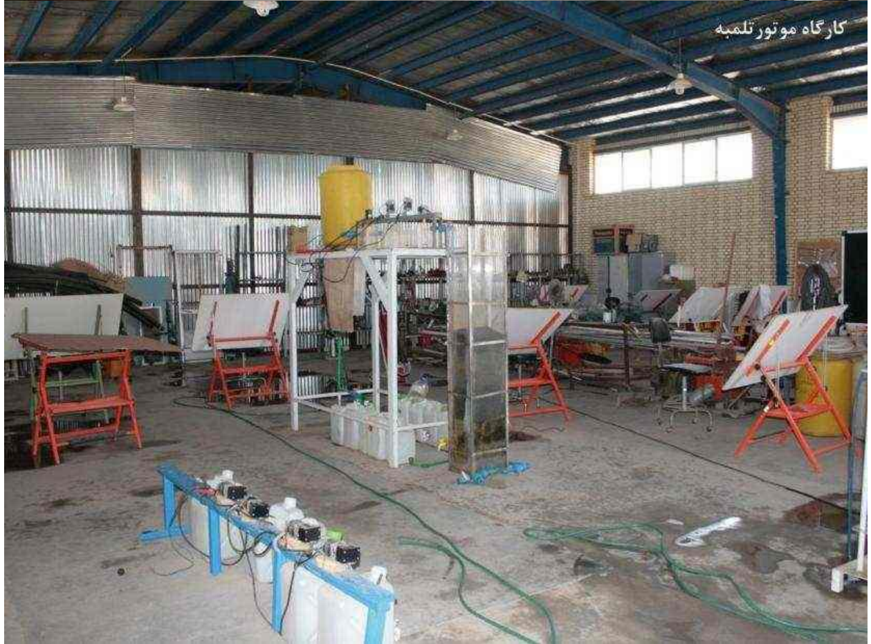
کارگاه موتور تلمبه