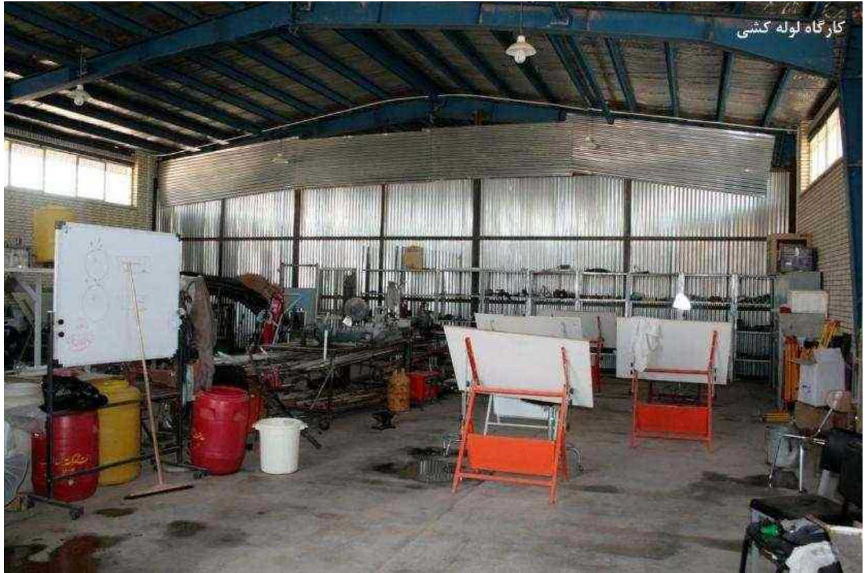
کارگاه لوله کشی