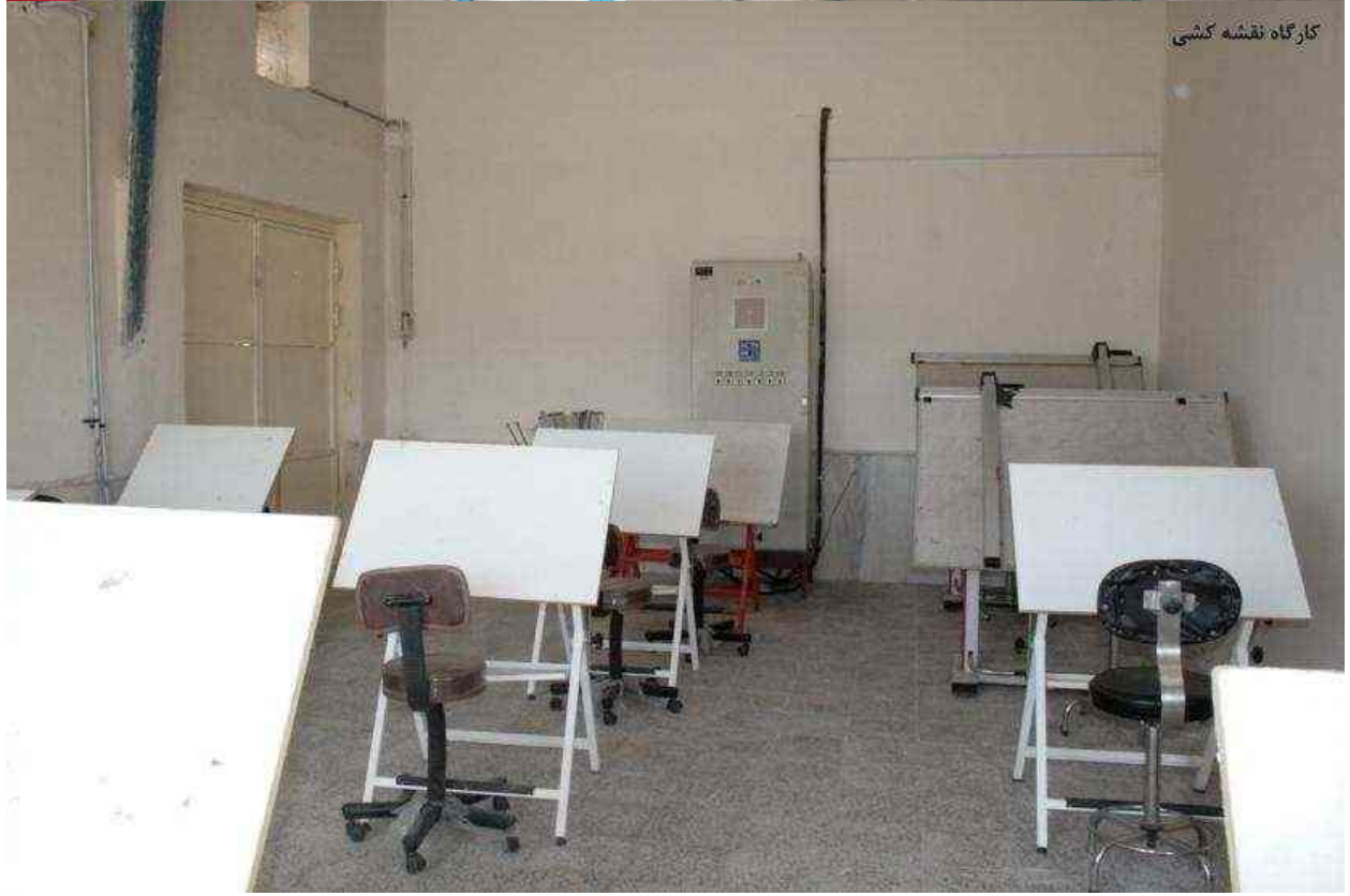
کارگاه نقشه کشی