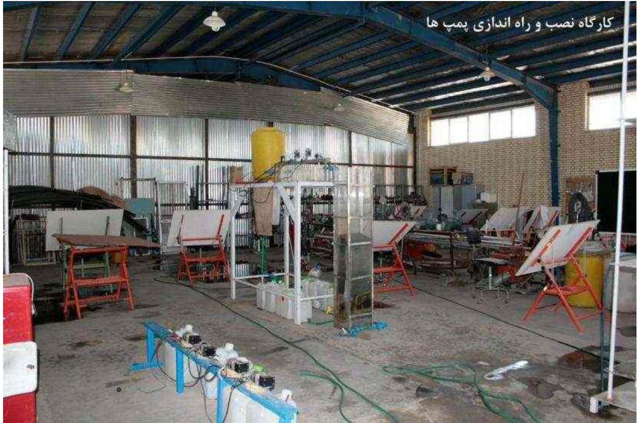
کارگاه نصب و راه اندازی پمپ ها