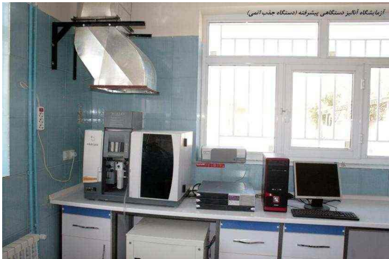
آزمایشگاه آنالیز دستگاهی پیشرفته (دستگاه جذب اتمی)